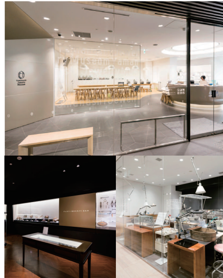
山梨縣立寶石美術專門學校附屬寶石博物館

這間博物館可以瞭解山梨的地方特色產業——珠寶業的精髓。館內介紹山梨成為一大產地的詳細歷史，展示水晶等礦物，並有其加工工具的解說，此外還設置有展覽和影像資料，介紹活躍於山梨的珠寶創作者們的作品、珠寶產地獨有的多彩魅力等。在此還可觀看匠人的實際表演，並在體驗工房親手體驗製作過程，不論是孩子亦或是大人，都可近距離接觸珠寶的魅力，從中獲得樂趣。這間博物館是山梨縣立寶石美術專門學校的附屬博物館，作為寶石製作技術和寶石教育的相關機構，一直致力於培養以珠寶為理想的人才，並為山梨縣珠寶產業的未來發展做出應有貢獻。