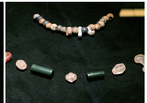
[上]石制勾玉 管玉 [下]水晶制切子玉 碧玉制管玉 (山梨縣立考古博物館收藏)

[上]“Think...溢”(Koo-fu Collection 2016 —SPLASH—)