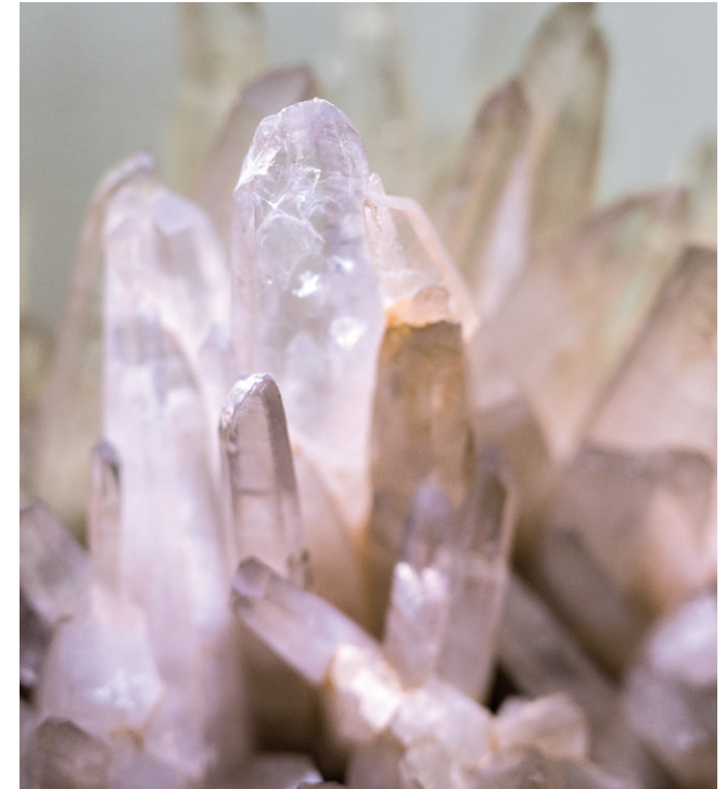
「水晶峠產水晶晶族」(山梨大學收藏)

以縣北部的金峰山一帶為中心的地區出產水晶，山梨縣的珠寶產業也因而誕生。其起源可追溯至江戶時代末期，據說天保年間（1830~1843），京都的玉石匠人來到甲州（現山梨縣地區）採購水晶時，將水晶研磨技術傳授給了昇仙峽深處的金櫻神社的神職人員們。此後的明治時代，在原有的基礎上又融入了用於裝飾品製作的貴金屬加工技術，逐漸發展並專業化為市場性較高的首飾製作工業。進入大正時代後，切割技術取得飛躍進步，並進入機械化時代，大量生產得以實現後，「水晶的山梨」在日本全國揚名，獲得巨大發展。而進入昭和時代後，因戰爭工業遭受沉重打擊。不過，戰後美國駐軍需要購買日本特產，首飾的需求大增，給產業帶來了新的生機，此後，東京奧運會的舉辦和經濟騰飛更是助力其發展。而今天的山梨已成為日本首屈一指的珠寶產地。匠人們在任何時期都致力於鑽研技術，正是他們的精神和技術才造就了今天的成績。山梨的珠寶產業致力於打造具有國際競爭力的品牌，為使發展更上一層樓，始終不斷地挑戰著。