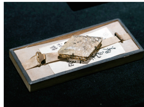
「著色黃水晶 腰帶扣(大正初期)」 (山梨大學收藏)