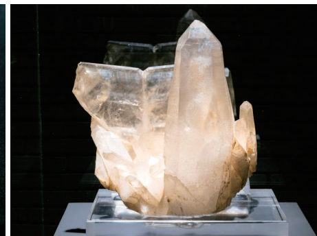
「第十號傾斜式學晶(產地:山梨縣增富村小尾)」 (山梨大學收藏)