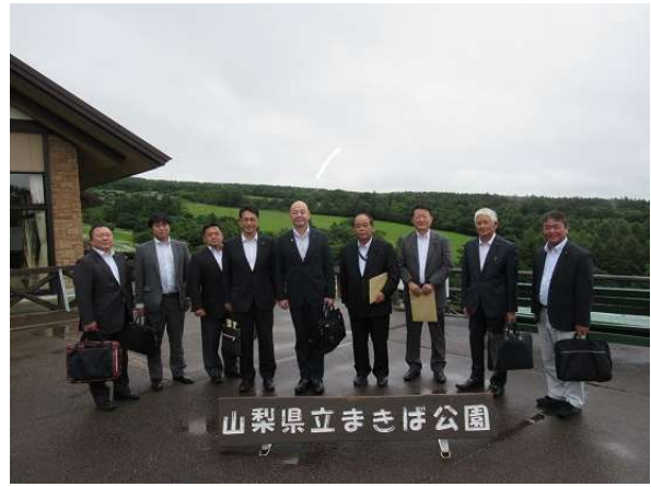
※子牛育成協会看視舎会議室で説明、質疑を行った後、現地視察を行った。