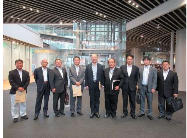
※図書館2階多目的ホールで説明、質疑を行った後、現地視察を行った。