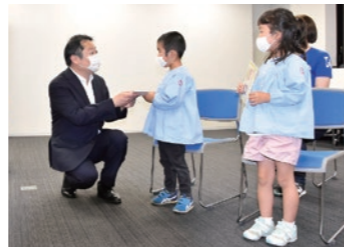
手作りマスクプロジェクトの出荷式で園児にマスクを手渡す長崎知事