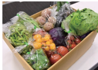
農産物パックの販売により生産者を支援

新型コロナウイルス感染症は一過性ものではありません。また、今後も未知の感染症が発生する可能性があります。このため県では、感染拡大防止と経済活動を両立できる「超感染症社会」を目指し、さまざまな取り組みを行っています。その一環として、事業者を対象とした「休業協力要請の個別解除」と「やまなしグリーン・ゾーン・ゾーン認証制度」を導入しています。これは他の自治体にはない山梨県独自の取り組みです。