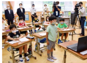
ICT教育を進める道志村立道志小学校を視察する長崎知事