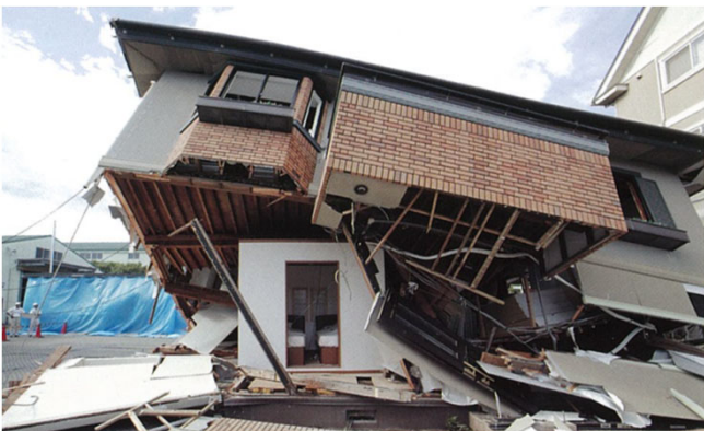
▲倒壊実験後のシェルター外観