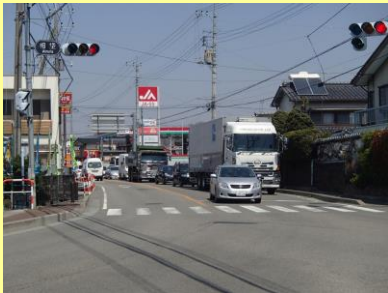
整備前（右折車両による渋滞状況）

レーンの分離が充分ではないため、朝夕の通勤時間帯には韮崎市街地方面へ向かい車両に交通渋滞が発生していました。