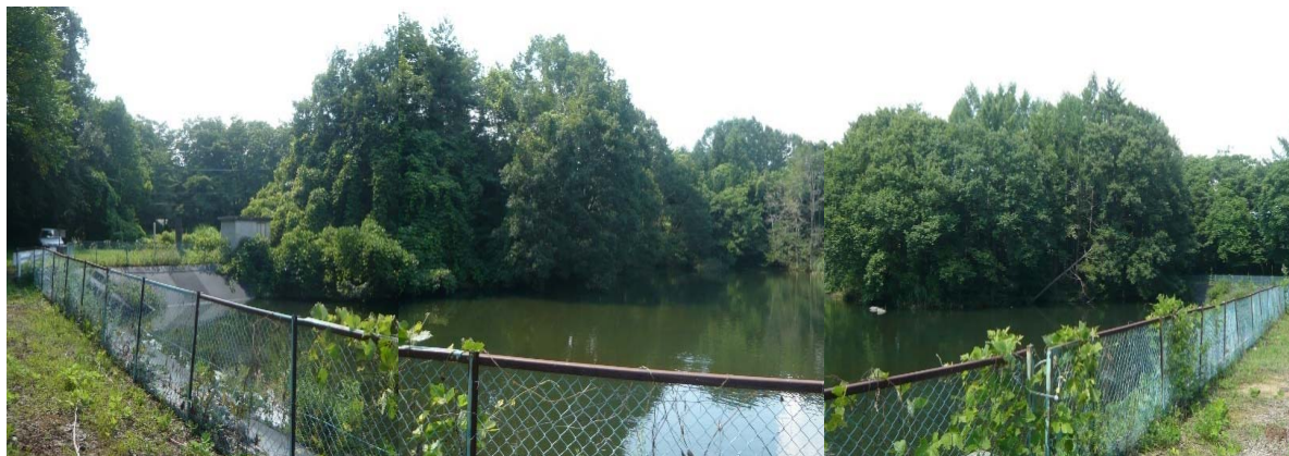
① 大井ヶ森ため池 全景 安全率(地震時) 1.14 \leq 1.20 (基準値) 貯水量 11,000m 3 , 堤高 H=7.9m