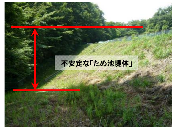
② 堤体の安全性が低く余裕高も不足している。