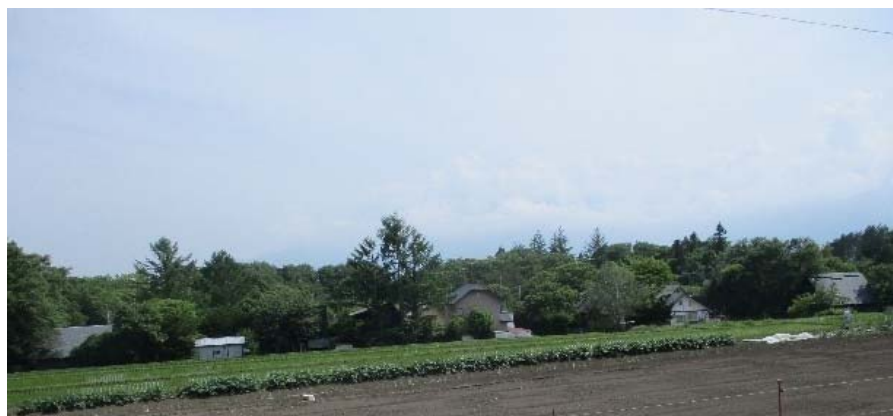
③ ため池下流には人家があり、大型地震の際には甚大な被害のおそれがある。