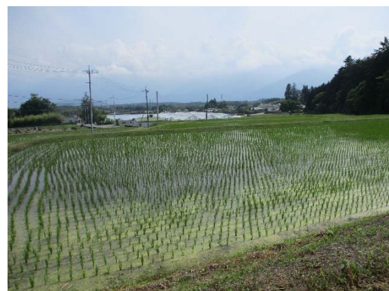
④ ため池下流の受益農地の状況。