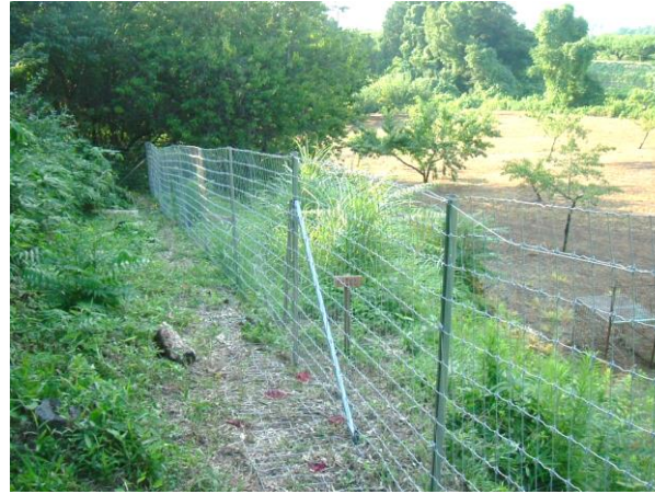
シカ等による農作物被害が軽減され、耕作者の営農意欲が向上している。