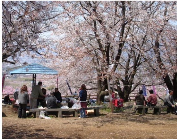
桃の花の時期には、笛吹市桃源郷春まつりの散策コースとしても利用され、多くの方が訪れ賑わいを見せている。