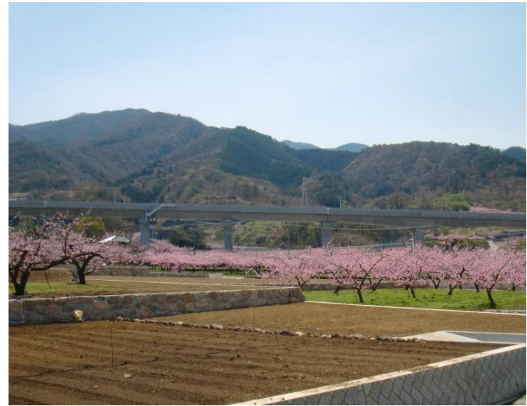
完成後 区画が整形され作業効率が向上し、営農条件が改善した。