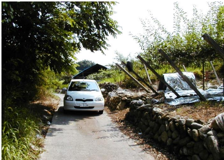
着工前 農道の幅員が狭く、すれ違いができないため、通行に支障をきたしていた。