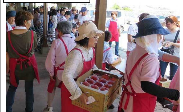
地区近隣の農産物直売所では、基盤整備により高品質な農産物の生産が可能となったことから、初夏から秋にかけてはもも等の果物が取り揃えられ、市内外から多くの方が訪れている。