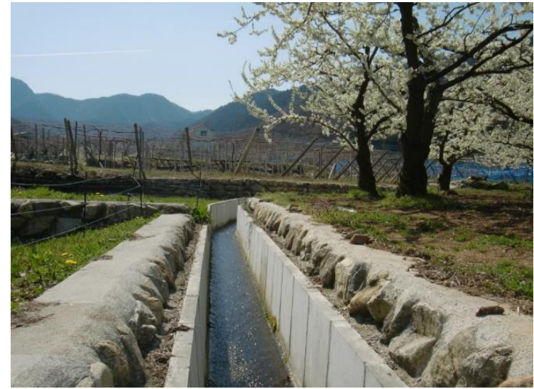
完成後 水路整備により、もも、ぶどうの生産性が向上するとともに、維持管理が大幅に軽減された。