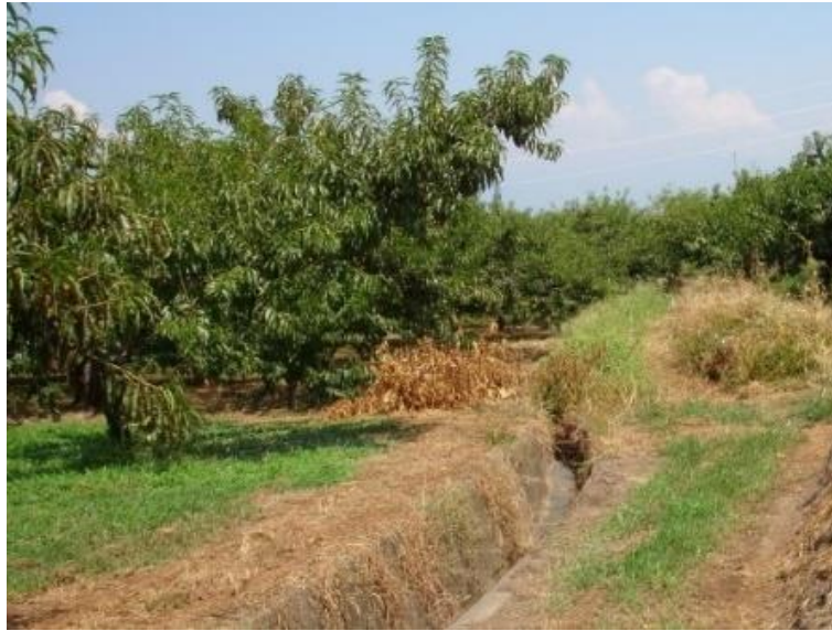
着工前 狭小で不整形な区画のため、農作業に労力を要していた。