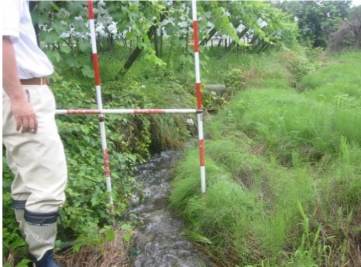
着工前 未整備のため、表土の浸食や排水不良が生じていた。