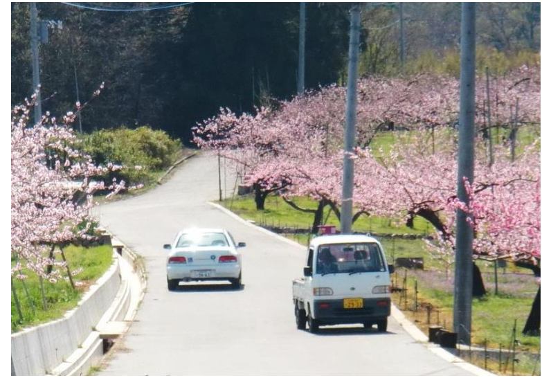
完成後 農耕車のほ場への乗り入れや、すれ違いが容易に行えるようになり、農作業の利便性が向上した。