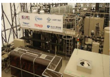
P2Gシステム実証研究棟内部