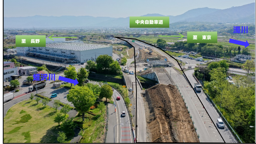
西下条ランプ付近