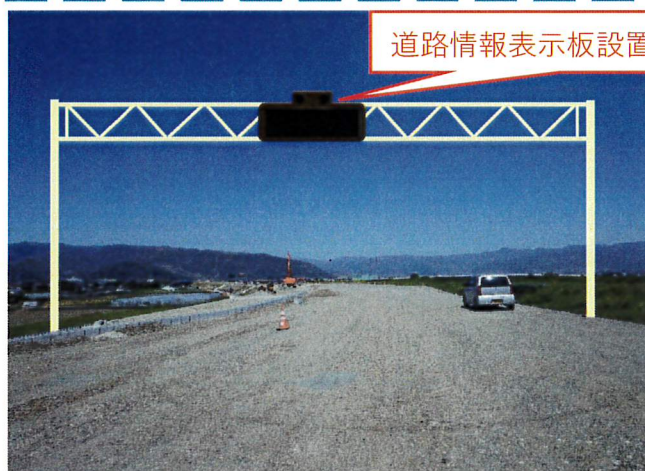
道路情報表示板設置（門型式）

平素より新山梨環状道路建設工事へのご理解とご協力を賜りまして誠にありがとうございます。 本工事も機器・支柱の工場製作が終盤をむかえ5月より現地での設置作業となります。従事者一同安全第一で完成を目指します。引き続き変わらぬご理解とご協力をお願い致します。