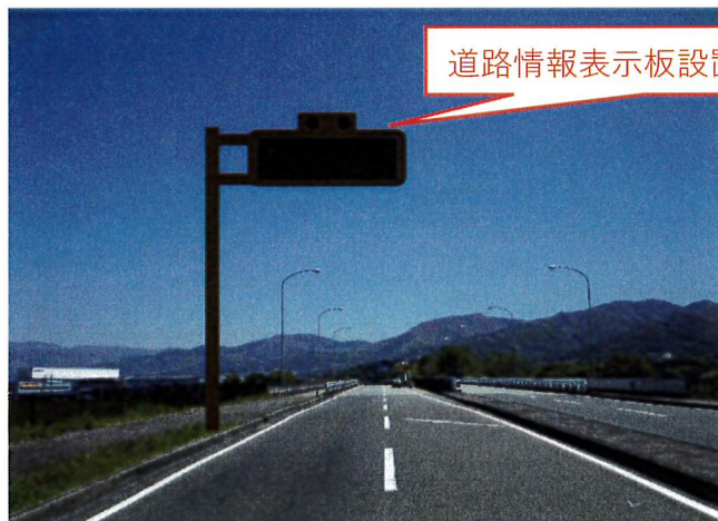
道路情報表示板設置（片持式）