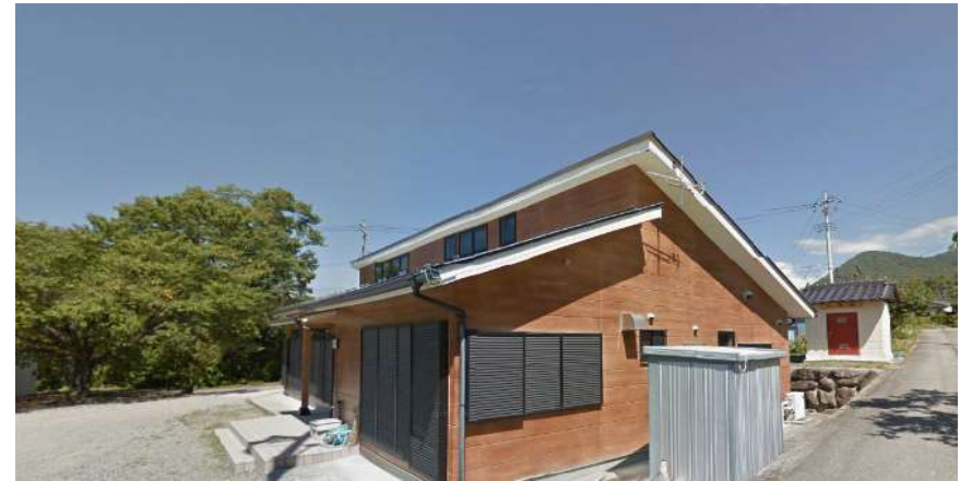
保全対象：小倉コミュニティセンター（公民館）