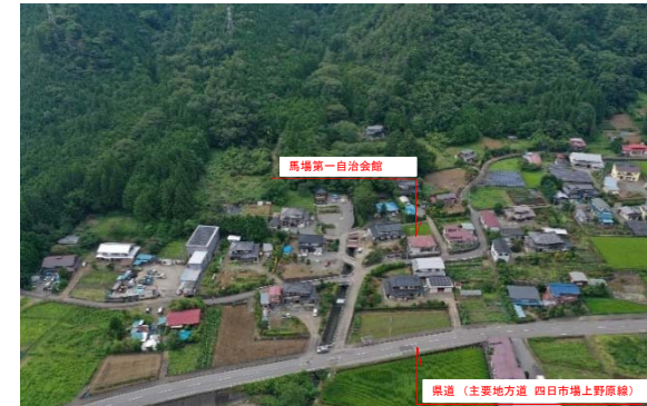
保全対象 (人家・県道・市道)