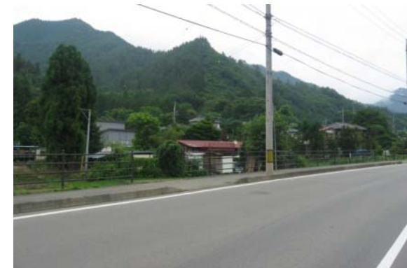
県道 (主要地方道 四日市場上野原線)