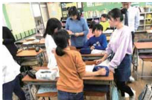
▲教師が児童の話し合いに対話的にかかわる

「目指す児童の姿」の実現に向けての支援となるように留意する。特に、意思決定の内容については、児童自身の考えとなるようにすることがポイントとなる。