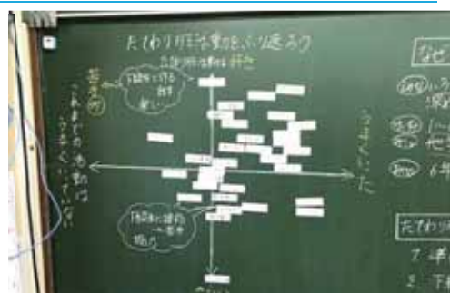
▲「ポジショニングマップ」で視覚的にも分かりやすく

自己評価に基づいた話し合い活動を通して、お互いの成果や課題、よさ等について相互評価を行う。それにより、自分らしさへの気づきとともに、自己実現に向けた意思決定の深まりを促す。